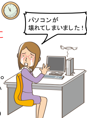
二重、三重のバックアップ必要

パソコンや外部ストレージ(USBメモリ・外付けハードディスクなど)の突然の故障により、大切なデータを失ってしまうお客様が残念なことに、いまだに多く見受けられます。突然の故障で、データ復旧必要となり専門業者へ依頼すると、数万から数十万円程度の復旧見積が算出される場合があります。