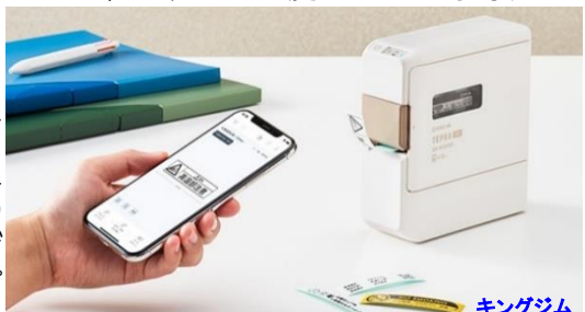
キングジム SR-R2500P 8,800円

スマホ専用テプラは以前からあったのですが、その廉価版モデルが登場しました。キーボードなどは付いておらず、スマホアプリで操作できます！そして電池式なのでいちいち電源コードをコンセントに挿すことなく、必要な場所に持ち出してその場で即プリントなんてこともできますね。キーボードを使うのが苦手な方は